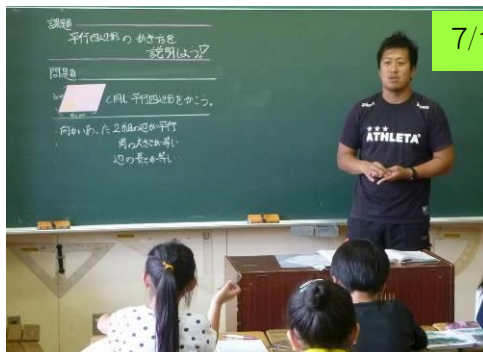
7/10 4年 四角形を調べよう