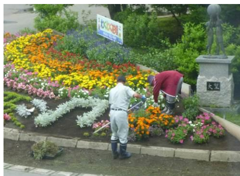
花壇の手入れを、校務員さんと養護の先生が中心となり行ってきています。