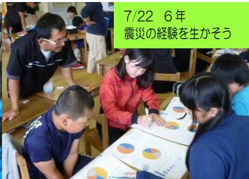
7/22 6年 震災の経験を生かそう