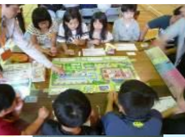
9/10 5年宿泊学習の様子です。