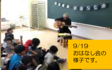
9/19 おはなし会の 様子です。