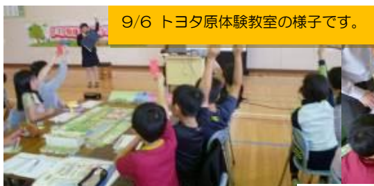
9/6 トヨタ原体験教室の様子です。