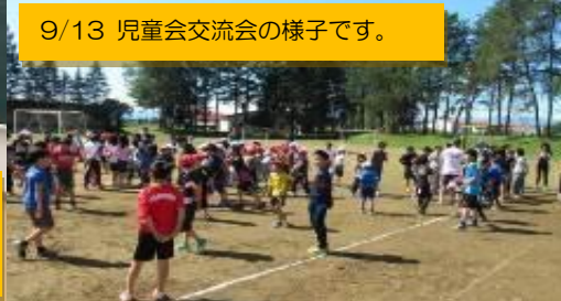
9/13 児童会交流会の様子です。