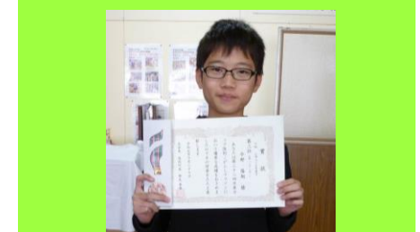
第22回 日産カップ 陸別こがらしマラソン 小学4~6年 男子の部