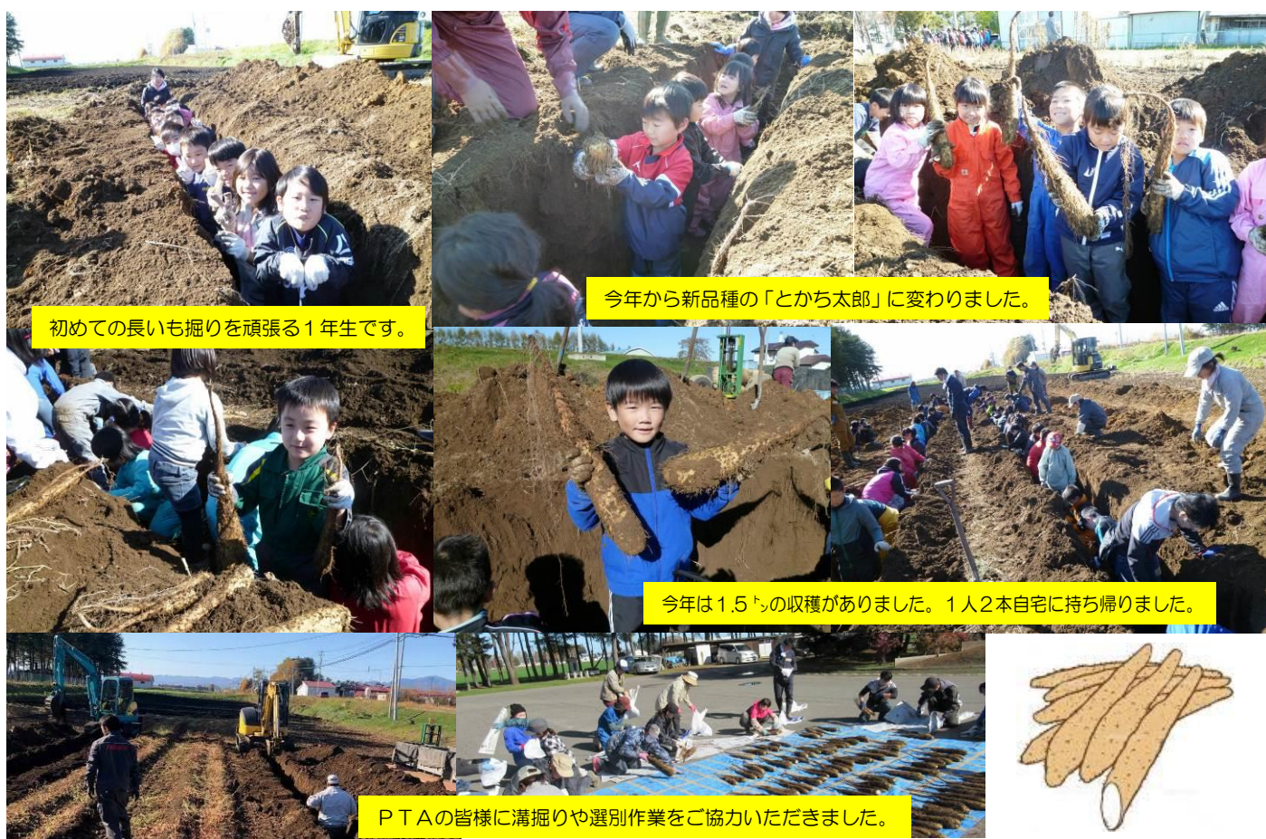
初めての長いもの掘りを頑張る1年生です。