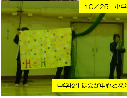
10/25 小学校で「帯広市小中合同サミット川西エリア集会」が行われました。