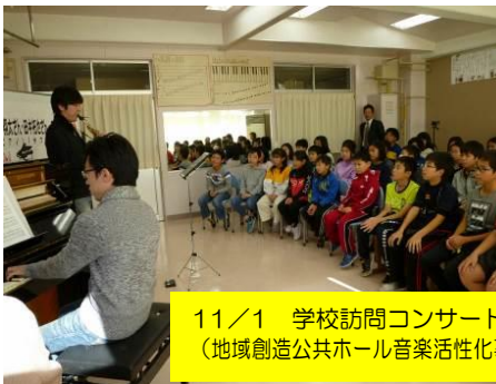
11/1 学校訪問コンサート (地域創造公共ホール音楽活性化事業)の様子です。