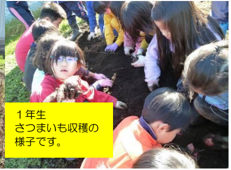
1年生 さつまいも収穫の様子です。