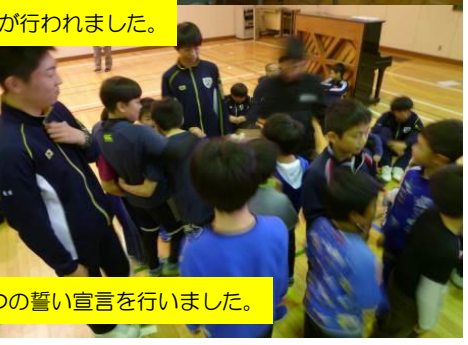
中学校生徒会が中心となり、ゲーム等で交流を深め、いじめ・非行防止5つの誓い宣言を行いました。