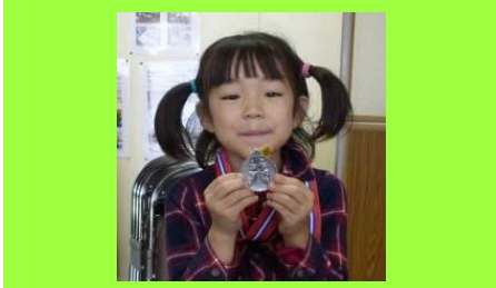
第50回 市民スポーツ剣道大会 小学1・2年 女子の部