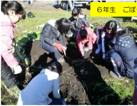
6年生 ごぼう収穫の様子です。