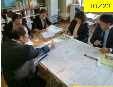
10/23 川西中公開研に本校職員が参観と研究協議に参加しました。