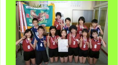
第39回 道新カップ 北海道小学生バレーボール大会 道東ブロック大会 男女混合の部