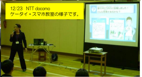
12/23 NTT docomo ケータイ・スマホ教室の様子です。