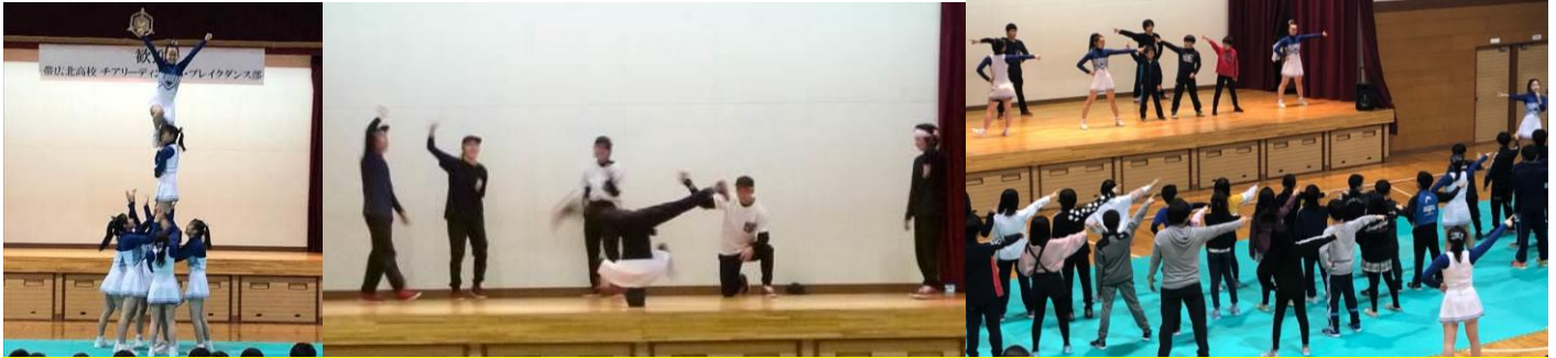
12/19 川西中学校で行われた「川西地区青少年健全育成協議会 帯広北高チアリーディング部・ブレイクダンス部発表会」に5・6年生が参加しました。迫力あるパフォーマンスに圧倒されたあとは、高校生からダンスを教わり一緒に踊りました。ステージ上の3人の男子を含め、みんなノリノリです。