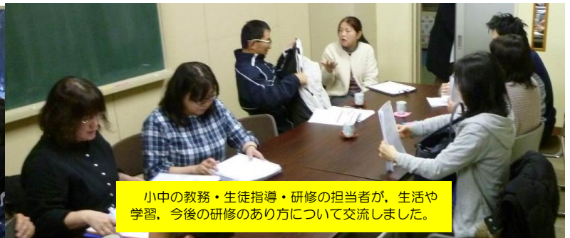
小中の教務・生徒指導・研修の担当者が、生活や学習、今後の研修のあり方について交流しました。