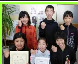
第36回石井杯 帯広市小学生バレーボール選手権大会 Aブロック 第3位 第35回大正・川西・清川バレーボール交流会 準優勝 帯広川西Aチーム