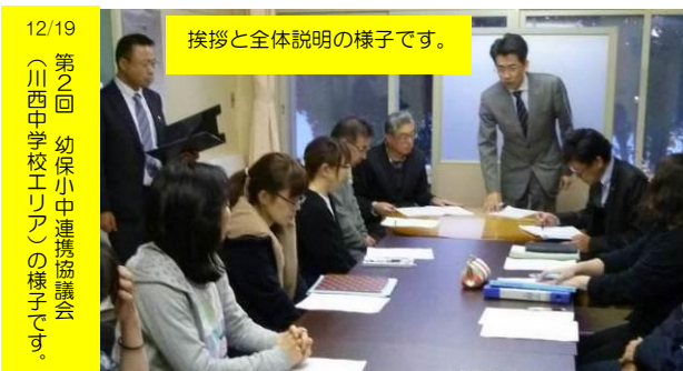
12/19 第2回 （川西中学校エリア）の様子です。