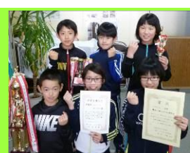
第36回石井杯 帯広市小学生バレーボール選手権大会 Bブロック 準優勝 第35回大正・川西・清川バレーボール交流会 優 勝 帯広川西Bチーム