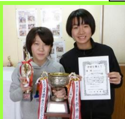
第36回石井杯 帯広市小学生バレーボール選手権大会 Aブロック 優 勝