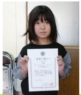
第57回 帯広市児童スケート大会 3年女子総合 6位