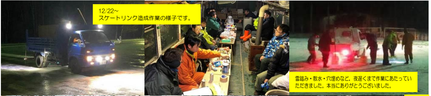
12/22～ スケートリンク造成作業の様子です。