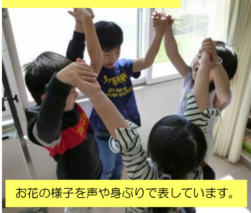
2年 音楽 「小さなはたけ」