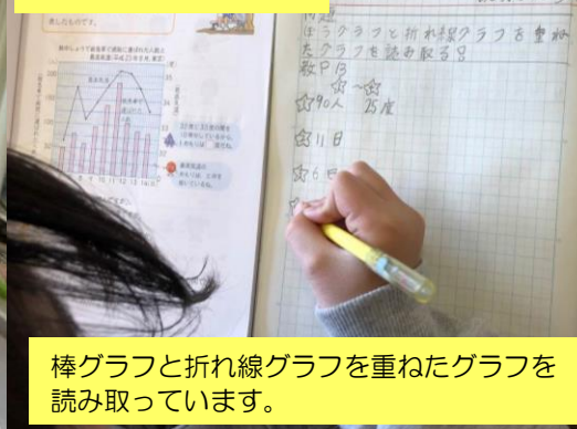
4年 算数 「折れ線グラフと表」