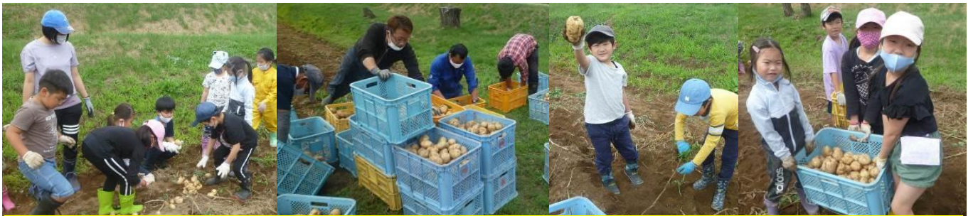
8/21(金) 1年生の皆さんが、学校農園のじゃがいも・とうもろこし・たまねぎの収穫を行いました。多くの児童が幼稚園や保育所で収穫を経験していましたが、ここまで大規模なのは川西小学校ならではの。みんな一生懸命収穫してくれました。その後は6年生とPTA役員・教職員で仕分けを行い、全校児童が収穫物を自宅へ持ち帰りました。