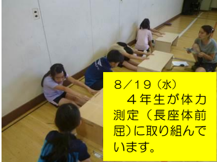
8/19(水) 4年生が体力 測定(長座体前 屈)に取り組ん で います。