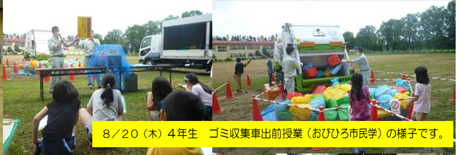
8/20(木) 4年生 ゴミ収集車出前授業(おびひろ市民学)の様子です。