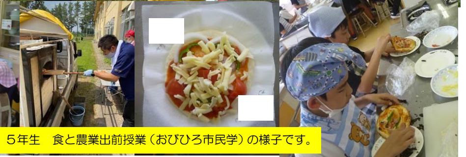
8/20(木) 5年生 食と農業出前授業(おびひろ市民学)の様子です。