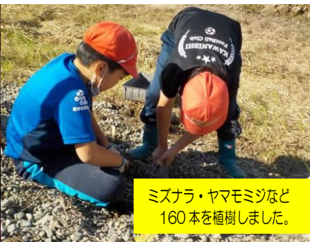
ミスナラ・ヤマモミジなど 160本を植樹しました。