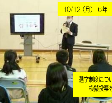
10/12(月) 6年 選挙出前講座(おびひろ市民学)

10/9(金) 4年生が治水の杜事業の植樹を行いました。苗木は成長して5年ほどで林になります。洪水対策に役立ってくれることを願います。