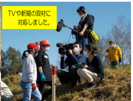
TVや新聞の取材に 対応しました。

10/9(金) 4年生が治水の杜事業の植樹を行いました。苗木は成長して5年ほどで林になります。洪水対策に役立ってくれることを願います。