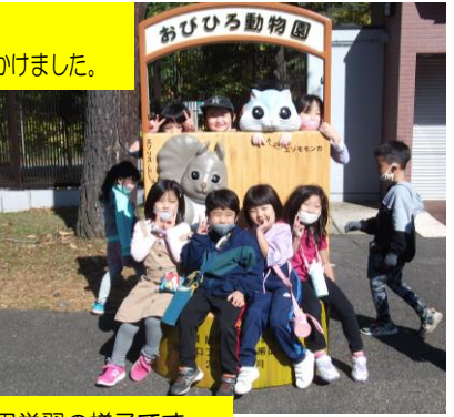
帯広動物園と 緑ヶ丘公園へ出かけました。