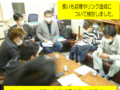
長いも収穫やリンク造成に ついて検討しました。