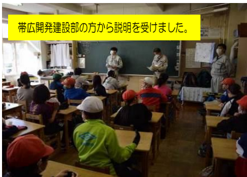
帯広開発建設部の方から説明を受けました。