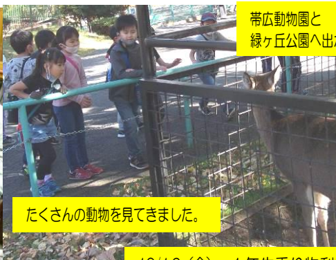
たくさんの動物を見てきました。