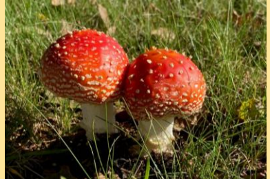
グラウンド横に生えるベニテングタケ この時期、毎年同じ場所に生えています。

川西地区老人会の皆様より、文具の寄贈をいただくことになりました。例年、祖父母参観日の際にいただいておりますが、今年は中止となったため、この時期の寄贈となりました。心より感謝申し上げます。