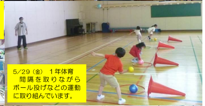
5/29 (金) 1年体育 間隔を取りながら ボール投げなどの運動 に取り組んでいます。