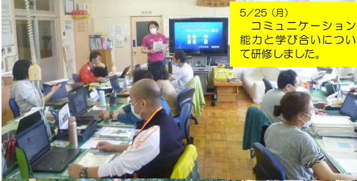
5/25 (月) コミュニケーション 能力と学び合いについ て研修しました。