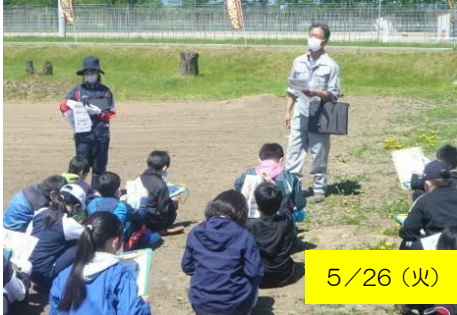
5/26 (火) 5年生 畑の先生授業(長いも)の様子です。