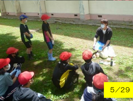
5/29 (金) 6年生 畑の先生授業(大豆)の様子です。