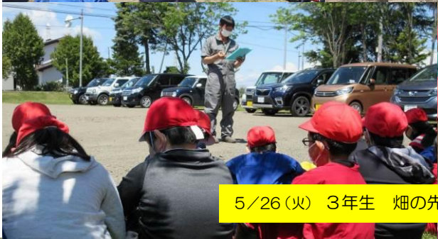
5/26 (火) 3年生 畑の先生授業(じゃがいも)の様子です。