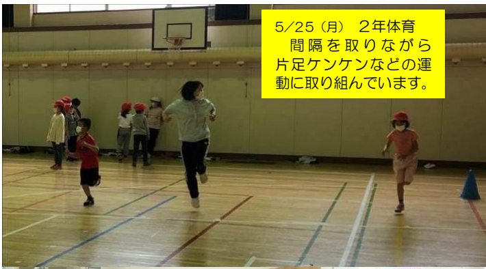
5/25 (月) 2年体育 間隔を取りながら 片足ケンケンなどの運 動に取り組んでいます。