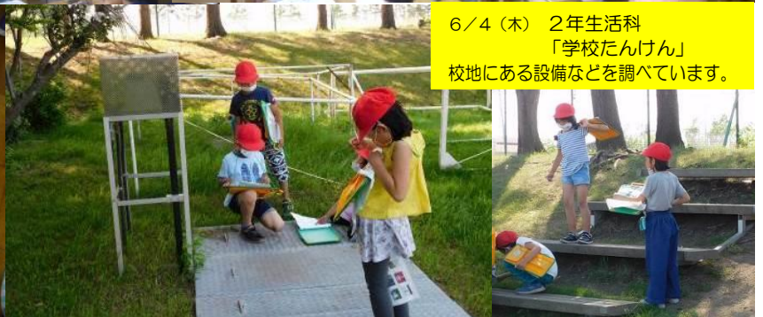
6/4（木） 2年生活科 「学校たんけん」 校地にある設備などを調べています。