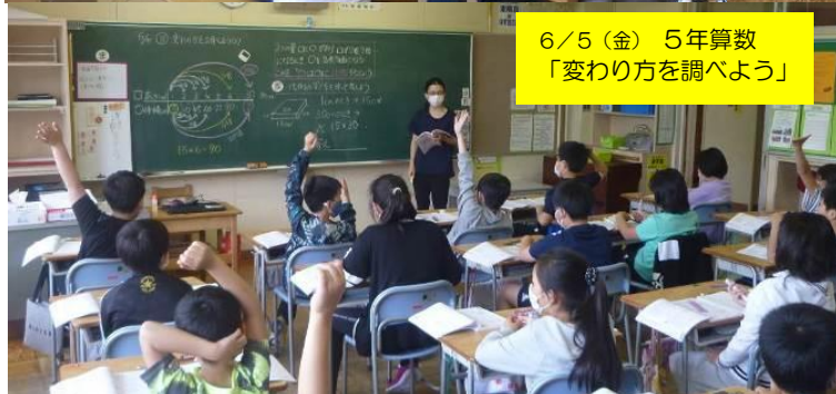
6/5（金） 5年算数 「変わり方を調べよう」