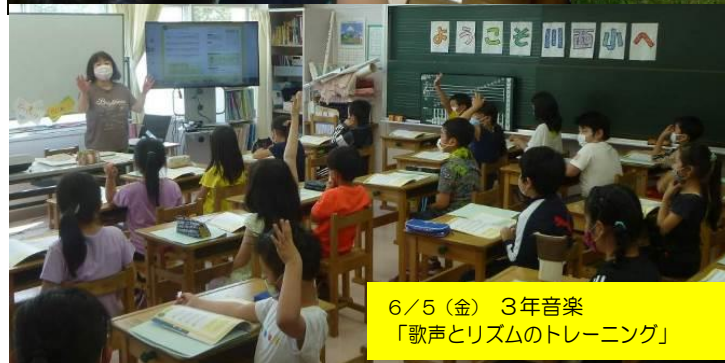
6/5（金） 3年音楽 「歌声とリズムのトレーニング」