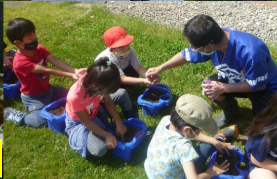
6/5（金） 1年生活科 「げんきにそだて わたしのはな」 あさがおのたねを蒔きました。