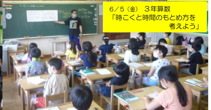
6/5（金） 3年算数 「時ごとと時間のもとめ方を 考えよう」