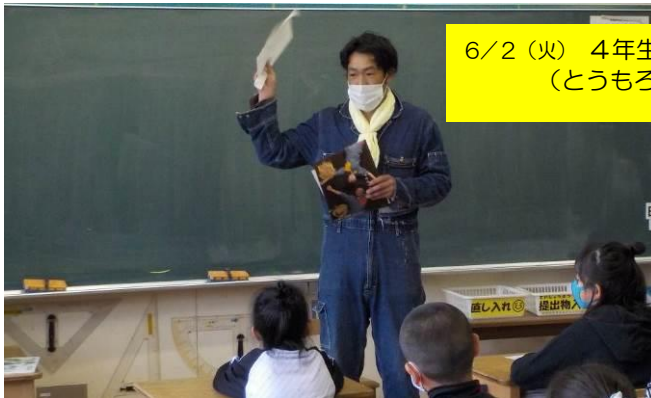
6/2（火） 4年生 畑の先生授業 （とうもろこし）の様子です。